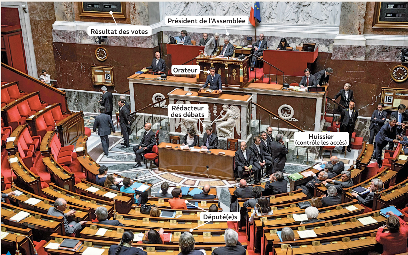
4 Une séance à l'Assemblée nationale (2017)